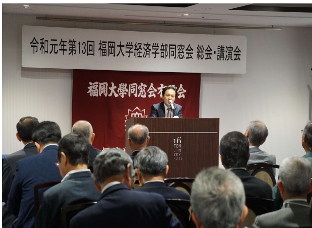
人間国宝 福島善三氏が講演(第13回)